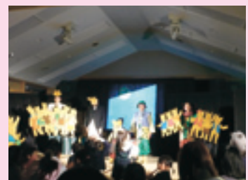
「劇団ブナの木」公演