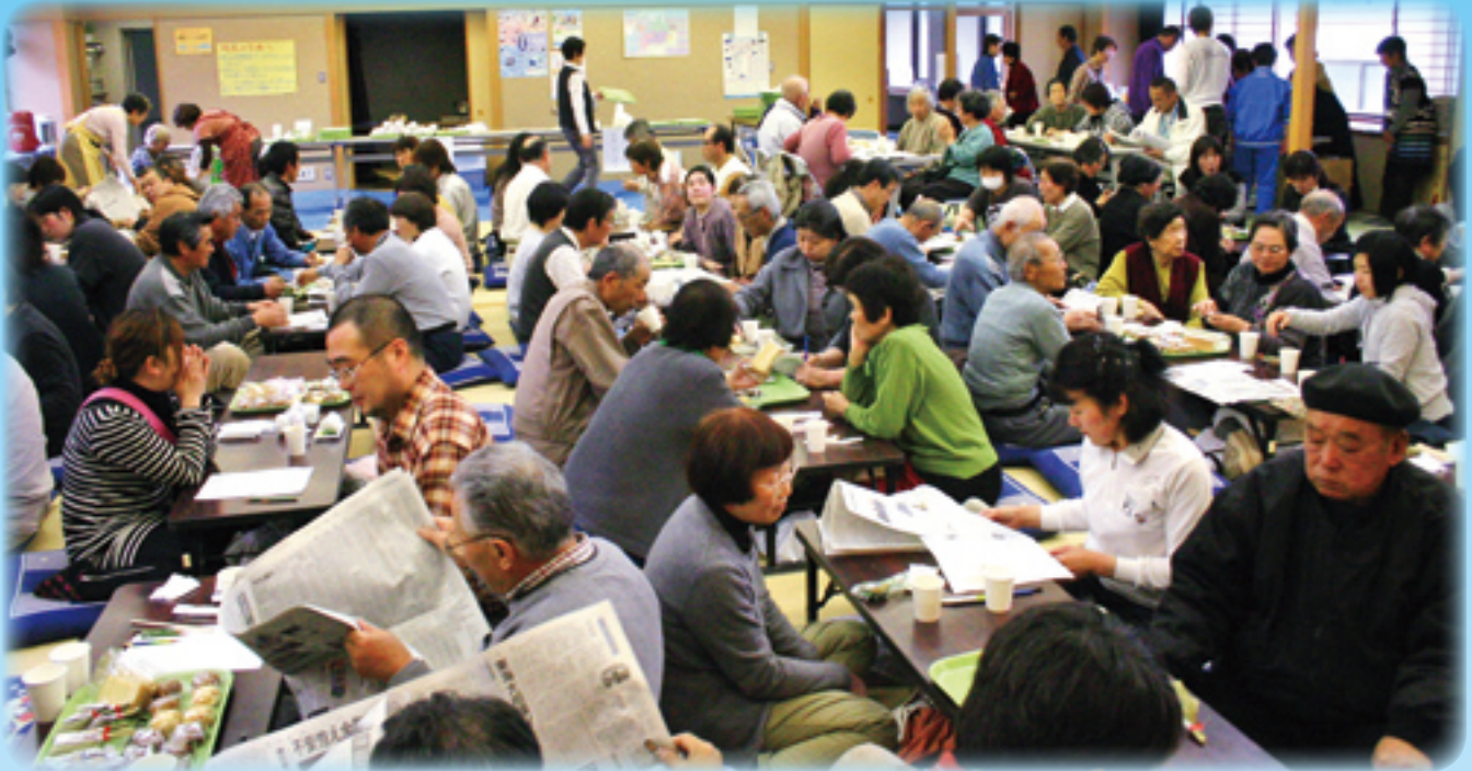
4月8日に行われた「被災者交流会」の様子

この度の東日本大震災により被災された皆様には心よりお見舞いを申し上げます。 皆様の安全と一日も早い復興を心よりお祈り申し上げます。